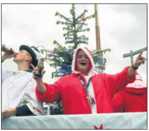
Frohes Fest: Die Jungesellen aus Gierswalde zählten mit ihrem Weihnachtswagen zu den Favoriten beim Allershäuser Festzug.