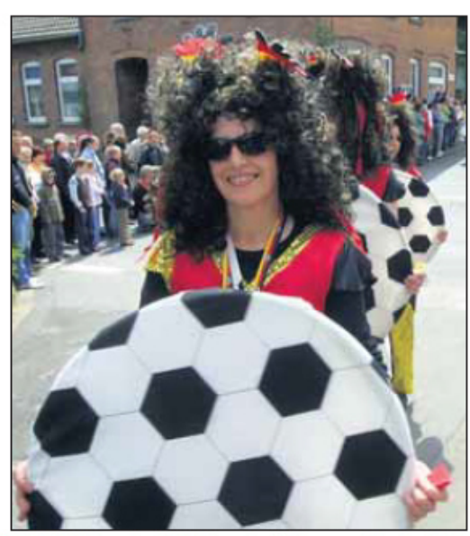
Zu Gast bei Freunden: Die Schonschen Sisters marschierten in tollen WM-Kostümen durch Allershausen.

Auf dem Programm der Allershäuser Party mit dem Motto 100 Jahre Allershausen (75 Jahre SV Rot-Weiß, elf Jahre Osterfeuergruppe, neun Jahre Heimat- und Kulturverein und fünf Jahre Eigenständigkeit als Uslarer Ortsteil ging am Sonntagabend mit der 75-JahrFeier des SV Rot-Weiß und am gestern mit einem Festgottesdienst, Frühschoppen und einer Gerichtsverhandlung weiter. BERICHT FOLGT